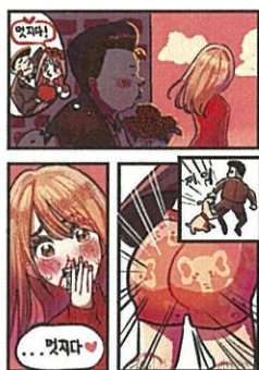
高中組「真棒！」 作品名:帥氣內褲 筆名:遊人(韓國)