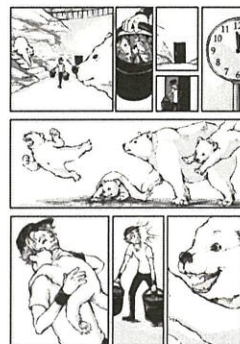
一般組(故事漫畫)主題自訂 作品名:You are my best gift 筆名:Akimichi(俄羅斯)