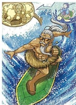
一般組(1頁漫畫)「東山再起」 作品名:TARO URASHIMA 筆名:Kitaoka Mitsuru (日本)