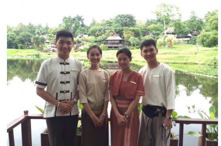
南應旅館第一屆四季酒店實習生 2014 攝影於清邁四季酒店

四季酒店的服務能做到世界知名，也有賴於全體員工的投入與付出。台南應用科技大學旅館管理系與四季酒店自 2014 年起以合作近 5 年，從在校生的研習、實習生的培育及畢業生職涯規劃，都有著很深入的合作與交流，從孩子們眼神中發出的光，我們了解夢想在孩子們的人生藍圖中正一步步地被實現著。這次我們邀請您一同來體驗四季酒店的訓練之道，一起繼續燃燒關於台灣餐旅教育的熱情與熱忱。